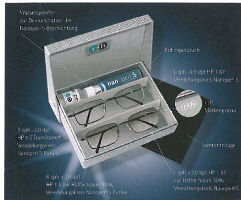
Die r+h Beratungsbbox: Gläser zum Anfassen und Verstehen

Das kleine handliche Format passt auf jeden Anpasstisch. Der Inhalt überzeugt durch die sinnvolle Ausstattung. Unterschiede zwischen dick und dünn, zwischen veredelt und unveredelt sind deutlich sichtbar. Getönte Gläser stehen im Vergleich mit klaren Varianten. Mit und ohne farbigen Restreflex. Auch ein