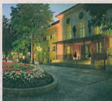
Kurmittelhaus der Moderne in Bad Reichenhall mit Fußgängerzone

ASLAN-Gesundheitszentrum Bad Reichenhall Salzburgerstrasse 7, D-83435 Bad Reichenhall Telefon (0049) 08651 / 76233-17 aslan@khmoderne.com , www.khmoderne.com