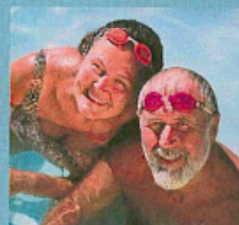
■ Seite 13 „Anti-Aging“ für die Gelenke