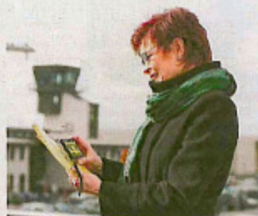
Sie benötigen für unterwegs und zu Hause eine Leselupe und nutzen gerne Produkte mit einfacher Handhabung? MANO setzt für Sie neue Maßstäbe: ein gestochenes scharfes Bild und eine stufenlose Vergrößerung.

Vergrößerungsstufe. Der Test kann einen Besuch beim Augenarzt jedoch nicht ersetzen. Ein Online-Shop, in dem erste Hilfsmittel bequem von zu Hause aus bestellt werden können, gehört ebenfalls zum Angebot der Webseite.