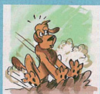
■ Seite 43 Vom Umgang mit dem „Ja, aber...!“-Reflex