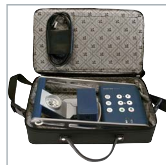
topolino click dans sa sacoche de transport