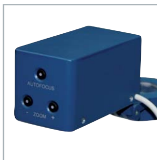
Zoom et gestion de l'autofocus

Courriers, chèques, prise de notes, jeux