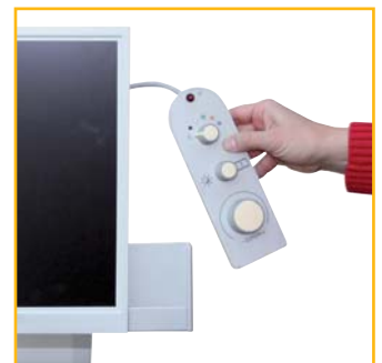
support de rangement des commandes